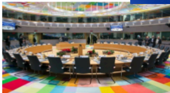
Κτίριο Ευropa, Βρυξέλλες, Βέλγιο

Έτσι, σε αυτό το παιχνίδι υποδύεστε έναν εθνικό υπουργό και ανακαλύπτετε τη διαδικασία λήψης αποφάσεων της ΕΕ διαπραγματευόμενοι πραγματικά θέματα που είναι κοντά στην καρδιά σας. Μπορείτε να διαπραγματευτείτε για έναν καθολικό φορτιστή για όλες τις συσκευές, τη μετάβαση σε ηλεκτρικά αυτοκίνητα και πιο πράσινα κτίρια ή την απαγόρευση των πλαστικών μιας χρήσης.