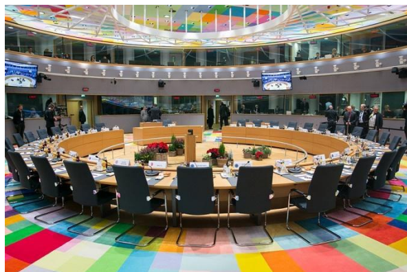
Budova Evropa, Brusel, Belgie

schvalování návrhů Evropské komise nebo k jejich vetování. Tato instituce je čistě mezivládní a skládá se z 27 ministrů členských států. V závislosti na projednávaných tématech se ministři mění. Například pokud se jedná o návrh týkající se rybolovných kvót, který je třeba projednat, bude o návrzích jednat 27 národních ministrů zemědělství.