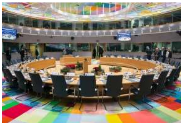
Bâtiment Europa, Bruxelles, Belgique

Remarque: Le Conseil de l'UE aussi appelé le Conseil est une institution européenne. C'est l'une des deux entités législatives avec le Parlement européen qui propose, amende et approuve ou veto des propositions de réglementation de la Commission Européenne. Cette institution est purement intergouvernementale et est composé des 27 ministres nationaux des Etats Membres de l'UE. En fonction des sujets discutés, les Ministres changent. Par exemple si la proposition qui doit être débattue est à propos de quotas de pêche, ce sera les 27 Ministres nationaux de l'Agriculture qui négocieront la proposition.